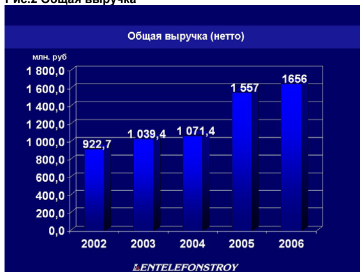
Рис.2 Общая выручка

Объем выручки составил рекордную цифру – 1 656 млн.руб. Из общего объема выручки объем строительно-монтажных работ составил 1359 млн.руб. Значительную долю в общем объеме выручки (18%) составили объемы по торговым сделкам, услугам автотранспорта, обучения персонала, проектным работам и от реализации продукции Опытного завода.